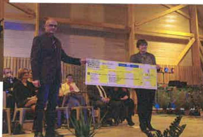
Suite au repas inter associatif, un chèque a été remis au CCAS d'un montant de 1963.41 euros