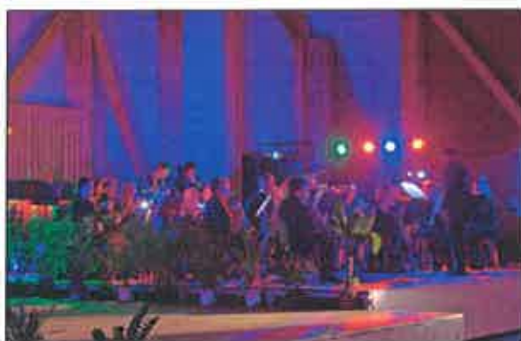
La participation de l'Harmonie Municipale