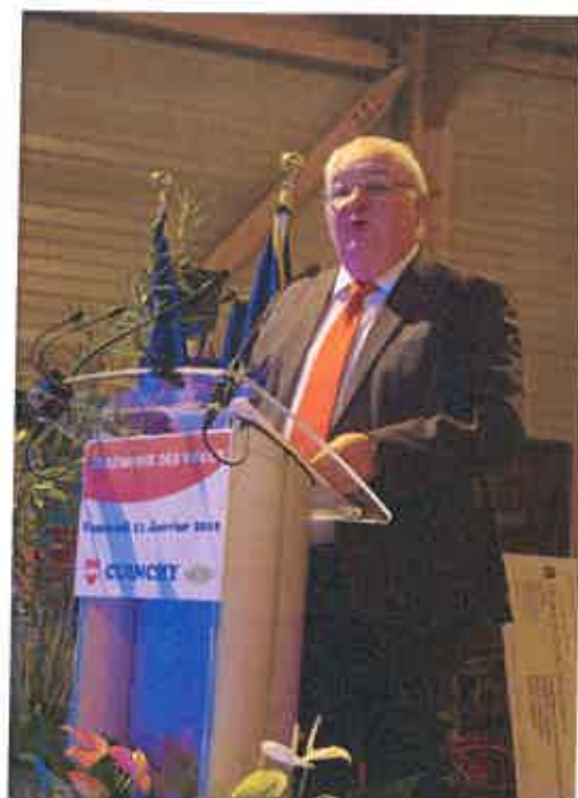
Le traditionnel discours de Monsieur le Maire