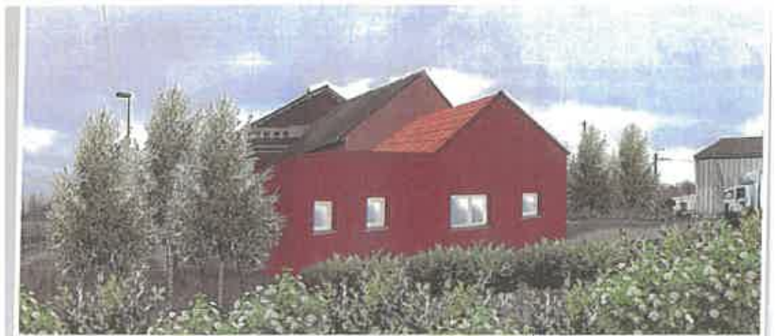
Projet 2 : Insertion dans le site depuis le terrain de la Cappe

Nota : L'insertion depuis la voie publique du projet 1 est aussi possible, mais la société