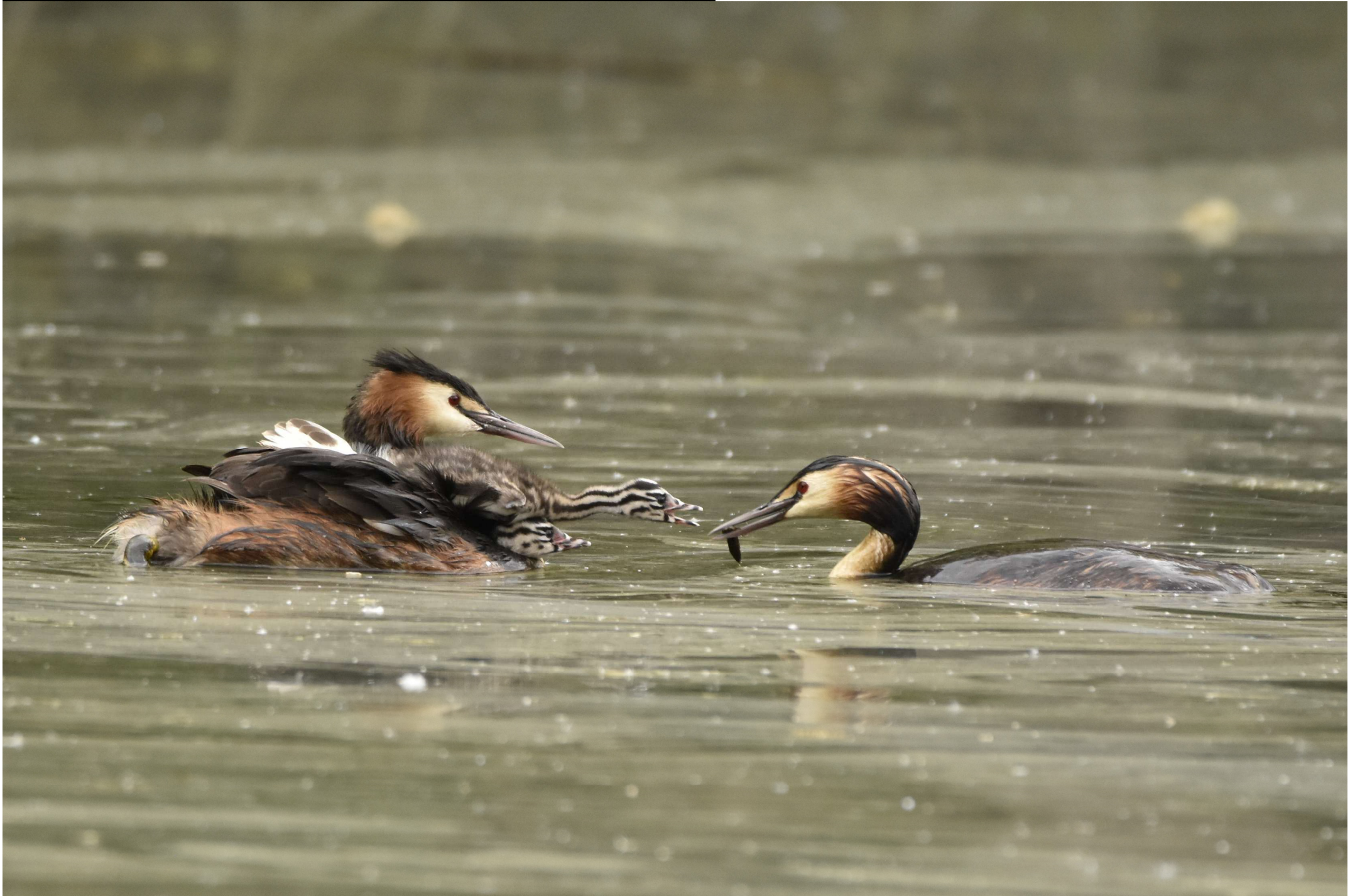
Grèbes huppés (Cambrin, mai 2022)